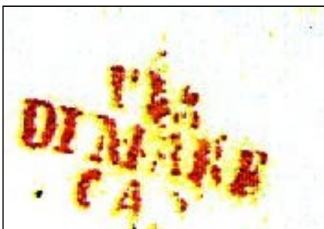
Hacia 1848. En Rojo. Hasta 1868

El 21 de septiembre de 1855 se firma un Tratado de Amistad, Comercio y Navegación entre el Reino de Cerdeña y la Confederación Argentina. La firma de este tipo de acuerdos bilaterales era común tanto en esa época como en décadas anteriores. Lo que siempre se discutía en estos Tratados era si se otorgaba o no el tratamiento de la "nación más favorecida" al contratante extranjero. Poco más tarde, el 11 de septiembre de 1856, el Gobierno de Buenos Aires (separado de la Confederación) conviene con el Gobierno sardo el transporte de correspondencia por medio de buques sardos con privilegio de paquete. El intercambio comienza en el mes de octubre de 1856. El recorrido de la ruta era Génova, Marsella, Cádiz, Lisboa, Madeira, Tenerife, Cabo Verde, Pernambuco, Bahía, Río de Janeiro y desde allí la conexión por otro buque con Montevideo y Buenos Aires.